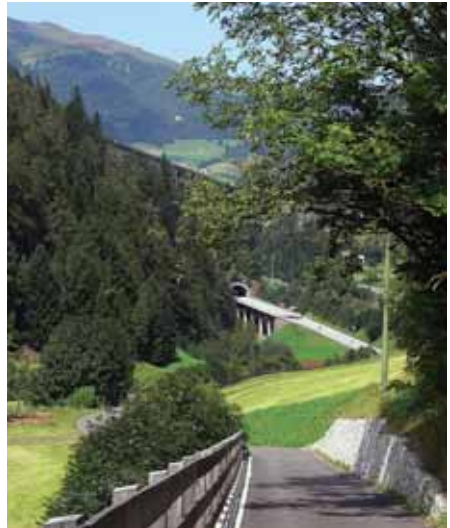
Bald durchgehend: der neue Radweg über den Brenner bis Bozen

Diese Route ist von österreichischer Seite aus leider noch nicht für Radler erschlossen. Die Brenner-Bundesstraße ist von Innsbruck über Matrei bis hinter Steinach gut ausge-