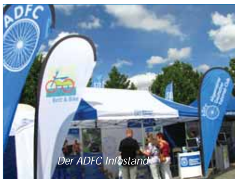
Der ADFC Infostand

Vor 20 Jahren war man da ziemlich skeptisch. Die meisten gaben ihr für ein zweites Mal kaum eine Chance. Zu schwierig die Logistik, die damals 800 Radlerinnen und Radler sicher durch das Land zu geleiten, zu verköstigen und unterzubringen. Wie würden die Städte und kleineren Orte reagieren, wie die Teilnehmer auf die schier unglaublichen Zumutungen in den Massenquartieren? Der Bayerische Rundfunk, der ADFC, die Polizei und das THW registrierten fast ungläubig die