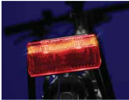
Ein patentiertes Linsensystem fächert das Licht beim TOPLIGHT Line plus zu einem durchgängigen, brillantroten Leuchtstreifen auf, der besser gesehen werden kann

Bei Dunkelheit ohne Licht zu radeln ist riskant. Der ADFC startet deshalb vielerorts auch dieses Jahr wieder Beleuchtungsaktionen und informiert an Infoständen über eine zeitgemäße Lichttechnik. Im Rahmen der Aktionen bietet er außerdem eine kostenlose Überprüfung der vorhandenen Fahrradbeleuchtung an. Kleine Schäden lassen sich dabei oft sofort an Ort und Stelle beheben. Hauptursache für den Ausfall der Lichtanlage ist eine Unterbrechung des Stromkreises. Für alle, die sich selbst auf Fehlersuche begeben wollen, gilt es also als erstes die Steckverbindungen am Dynamo und den Leuchten zu überprüfen, ob sie fest sitzen. Schwachpunkt bei der üblichen einfachen Verkabelung sind auch die korrosionsanfälligen Verbindungsstellen zum Rahmen, über den der Stromkreis geschlossen wird. Besser ist hier eine doppeladrigte Verkabelung.