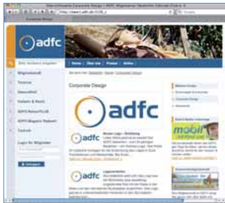
Das neue ADFC Design im Webauftritt

Auch im ADFC macht sich zunehmend die Kenntnis breit, dass die Wirkung und Durchschlagskraft eines Verbands nicht nur von guten Inhalten abhängt, sondern auch von der Professionalität der Präsentation. Deshalb ist es auch in der Umstellungsphase gar nicht wichtig, möglichst schnell zu sein, sondern besser etwas mehr Zeit darauf zu verwenden sich zu überlegen, wie man einen professionellen einheitlichen Auftritt hinbekommt.