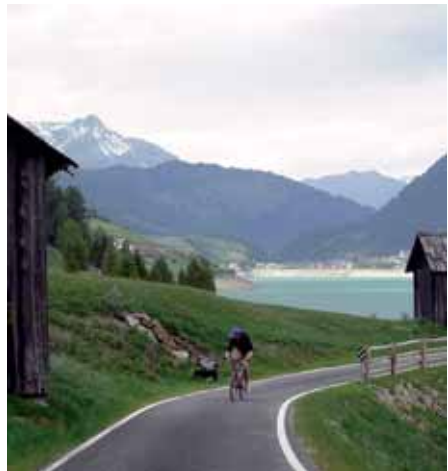
Radweg am Reschensee

Die Alternative: An der Kajetansbrücke der Bundesstraße Richtung Schweiz bis Martina folgen. Der Verkehr hält sich hier in Grenzen, dafür hat man schöne Blicke auf den Inn. In Martina links abbiegen, es folgt ein 6,5 km langer Anstieg zur Norbertshöhe