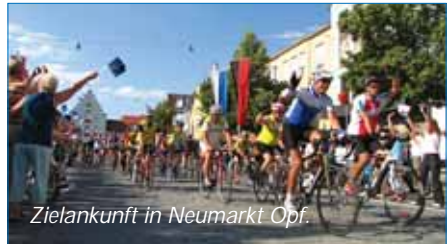
Zielankunft in Neumarkt Opf.